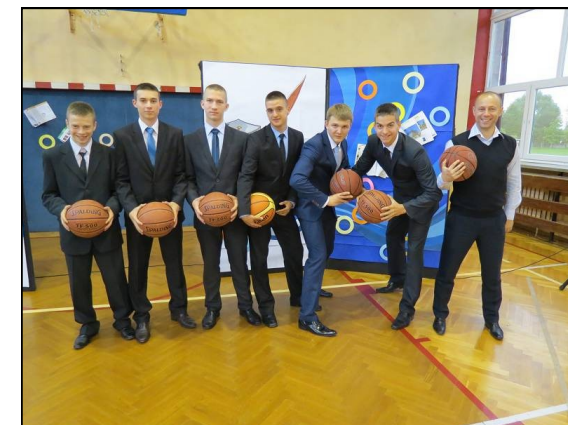
Nasi uczniowie zdobyli tytuł Mistrzów Podkarpacia

Dysponujemy dobrze wyposażoną salą rehabilitacyjną